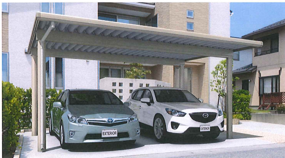
アーバングレー/4本柱/丸柱/基本タイプ/5555/H25/スチール折板:シルバー