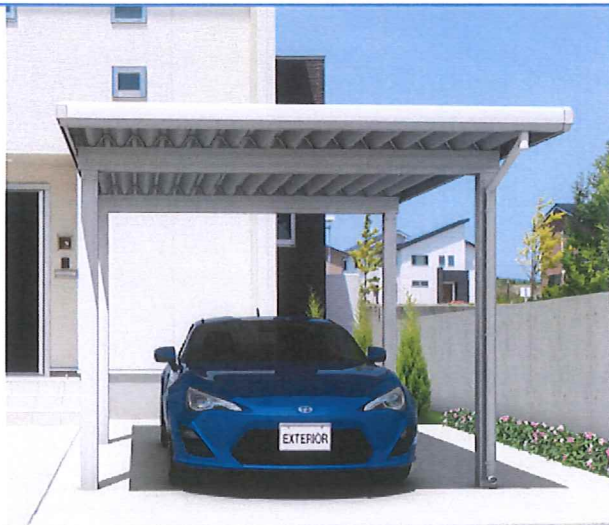
サンシルバー/4本柱/角柱/基本タイプ/5531/H23/スチール折板:シルバー

色 サンシルバー(SLC) アーバングレー(UC) ダークブロンズ(BD) ブラック(KO) スチール折板 シルバー(SI) 材質 本体:アルミ形材 屋根材(折板):ガルバリウム鋼板