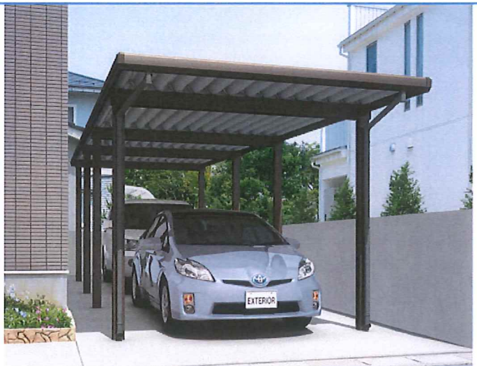
ダークブロンズ/8本柱/角柱/奥行2連結タイプ/(55-55)31/H25/スチール折板:シルバー